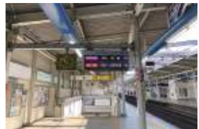
案内表示器更新工事