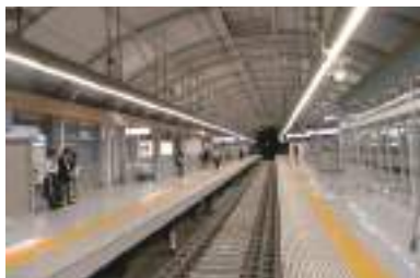
日暮里駅 総合改良事業工事