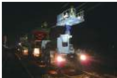
志津～ユウカリが丘間他電車線張替工事